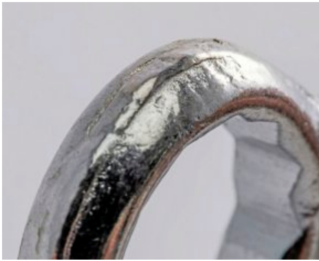
- DEUTLICH erkennbar ist die schlechte Oberflächenverarbeitung bei Brenar .