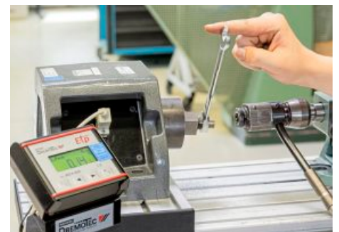
Leicht: Die Rückstellkräfte blieben unter den in der Norm definierten Werten.

DREHMOMENT-TEST: DER BILLIGSCHLÜSSEL VON BRENNAR GAB IM TEST ZU SCHNELL NACH.