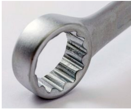
- MATTE Oberfläche, aber etwas unvollständige Chromschicht bei Gedore Red .