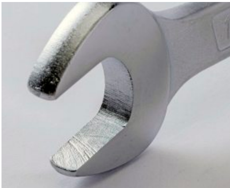
- BEARBEITUNGSSPUREN in der Maulöffnung bei Famex .