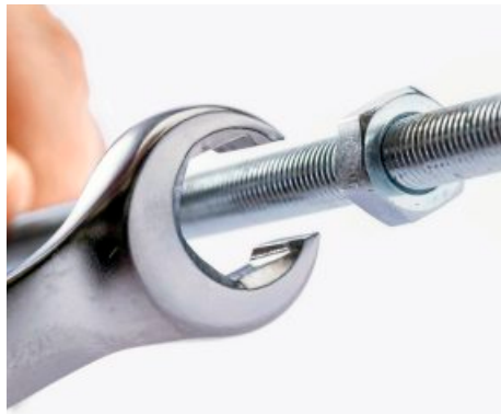
+ OFFEN: Die besondere Ringform bei Gedore Red hilft bei langen Schrauben.

chanik, die ein Drehen des Werkzeugs bei Wechsel der Schraubrichtung entbehrlich macht ( Hazet, Gedore und Gedore Red, Stanley, WGB ). Sehr praktisch ist auch die offene Maulseite beim drittplatzierten Set von Gedore Red , denn damit können Muttern an sehr langen Schrauben oder Gewindestangen ohne großen Aufwand betätigt werden. Auf der Maulseite ersetzt im gleichen Set ein kleines federgehaltenes Haltestück die Ratsche – diese Technik funktioniert in der Praxis ausgezeichnet und ist auch unter hoher Last stabil genug. Allerdings wird dafür in gleicher Währung gezahlt wie bei einer Ratschenfunktion: Das Maul ist mit mehr als 7 Millimetern breiter.