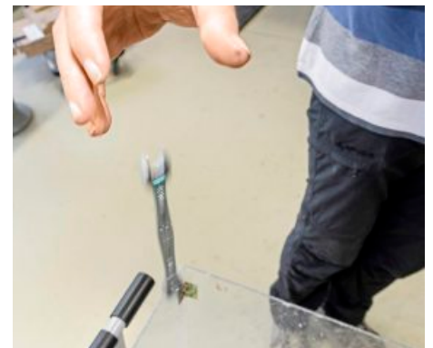
Den Falltest bestanden auch alle Werkzeuge mit Ratschenantrieb.