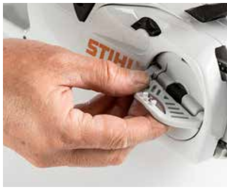
+ PRAKTISCH: Die Kettenwartung erfolgt stets werkzeuglos – hier bei Stihl .