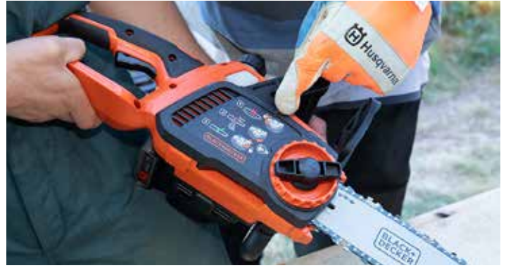
ANSCHAULICH: Bei Black&Decker wird direkt auf dem Kettenkasten erklärt, wie die Kette richtig gespannt wird.