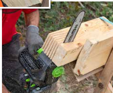
PRAXIS: Im Test haben wir Schnitte auch längs zur Faserrichtung beurteilt.