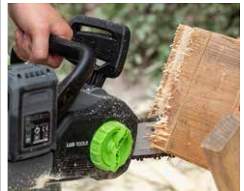
RUPPIG: Die Säge von Lux-Tools sägt zwar schnell, aber recht unsauber.