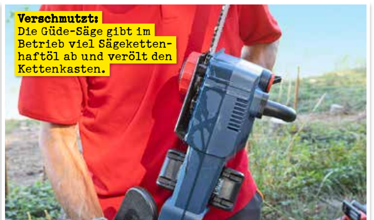
Verschmutzt: Die Güde-Säge gibt im Betrieb viel Sägekettenhaftöl ab und verölt den Kettenkasten.