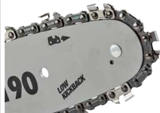
DEUTLICH: Meist ist die Montagerichtung der Kette am Schwert erkennbar.