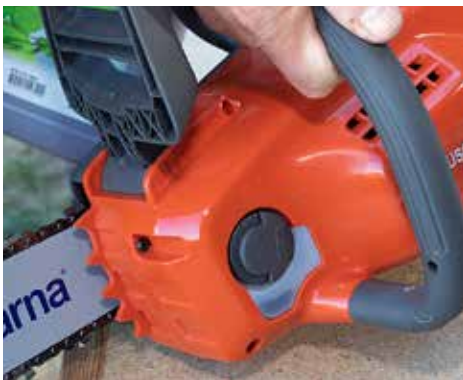
+ ANZEIGE: Der Füllstand des Sägekettenöls ist bei Husqvarna gut sichtbar.