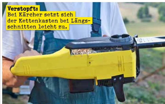
Verstopft: Bei Kärcher setzt sich der Kettenkasten bei Längsschnitten leicht zu.