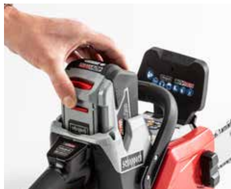
EINFACH: Der Akkutausch (hier bei Scheppach) fällt stets leicht.