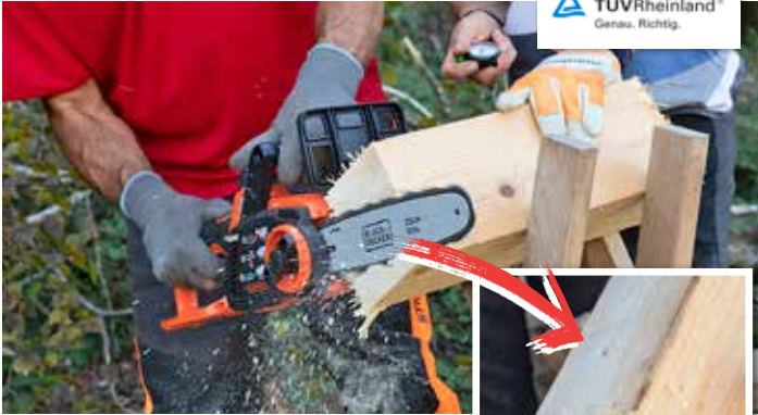
UNSAUBER: Die Säge von Black&Decker erzeugt starken Ausriss.