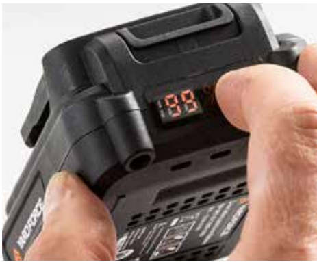
+ EXAKT: Bei Yardforce wird am Akku die Restladung in Prozent angezeigt.