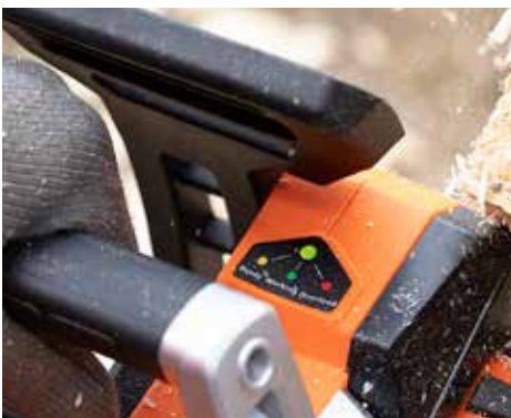
WARNUNG: Bei Yardforce gibt es eine Überlastungs-Anzeige für den Motor.