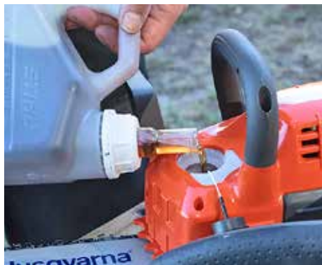
+ BEQUEM: Bei Husqvarna ist das Sägekettenöl komfortabel nachfüllbar.