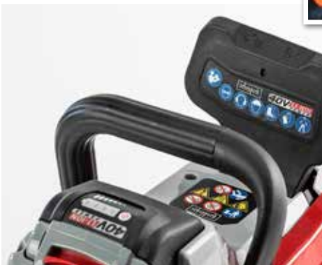
DEUTLICH: Bei Scheppach sind Sicherheits-Piktogramme gut erkennbar.