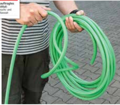
- WEICH: Bei Aqua Garden bilden sich widerspenstige Schlaufen.