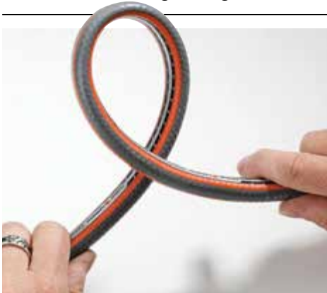
+ STABIL: Auch in engeren Schlaufen kann bei Gardena Wasser passieren.