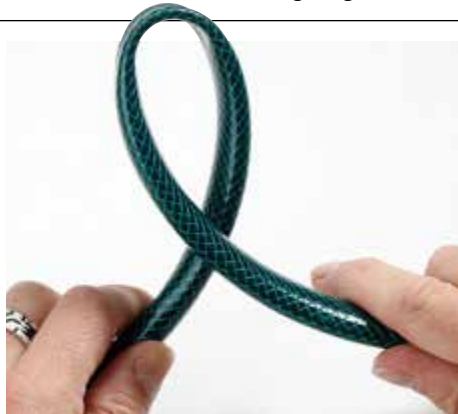
- SCHLAPP: Der Economic-Schlauch knickt ein und stoppt dabei den Zufluss.

und Fitt sind für ein Aufwickeln per Hand schon etwas zu starr: Nimmt man sie per Hand in Schlaufen auf, muss man sich der Laufrichtung des Schlauches anpassen – sonst bilden sich sperrige Schlaufen. Freilich ist dieser Effekt immer noch besser als ein Verknicen des Schlauches, der bei weicherem Material auftreten kann – im Test beobachtet bei den Schläuchen von Aqua Garden und ganz besonders deutlich bei Economic . Entsprechend erreicht Aqua Garden im Gesamtergebnis nur ein befriedigend , Economic sogar nur mangelhaft – auch, weil die vorgeschriebene Kennzeichnung fehlt.