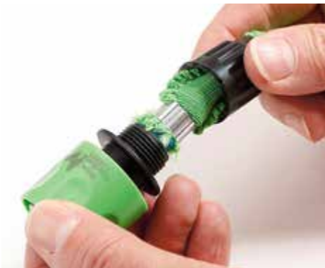
+ SICHER: Bei Royal Gardineer sichert eine Klemme die Schlaucharmatur.