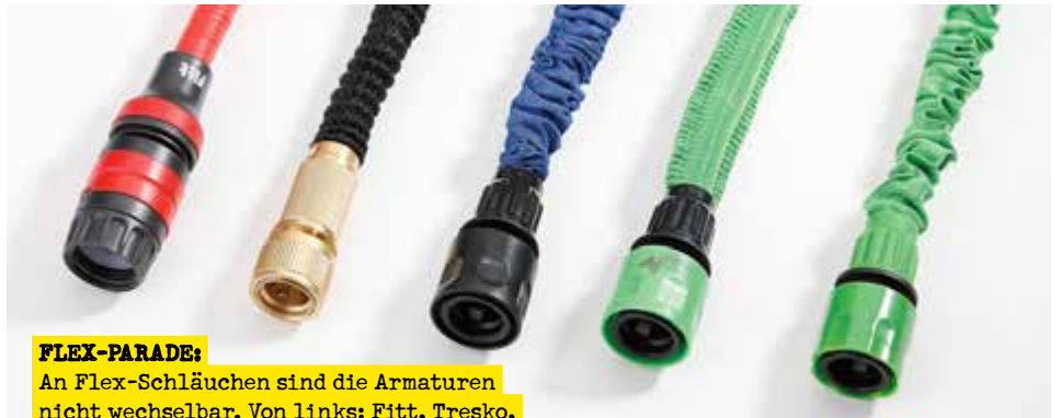
FLEX-PARADE: An Flex-Schläuchen sind die Armaturen nicht wechselbar. Von links: Fitt, Tresko, Con:P, Royal Gardineer und Plantiflex.