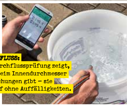
DURCHFLUSS: Die Durchflussprüfung zeigt, ob es beim Innendurchmesser Abweichungen gibt – sie verlief ohne Auffälligkeiten.

Kennzeichnung: Auch Schläuche müssen mit dem Namen des Anbieters gekennzeichnet sein – idealerweise sind außerdem Produktname und wichtige Daten aufgedruckt. Nur wenige Produkte erfüllten die in der Norm definierten Mindestanforderungen nicht.