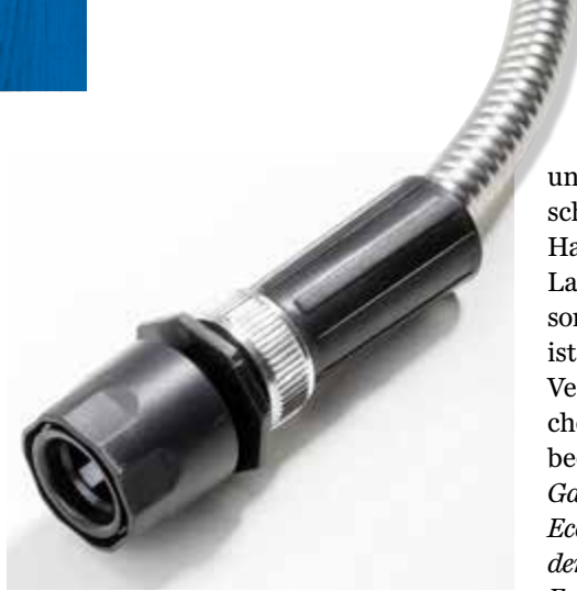
- SPERRIG: Bei Easymax ist der nicht wechselbare Anschluss recht groß geraten.