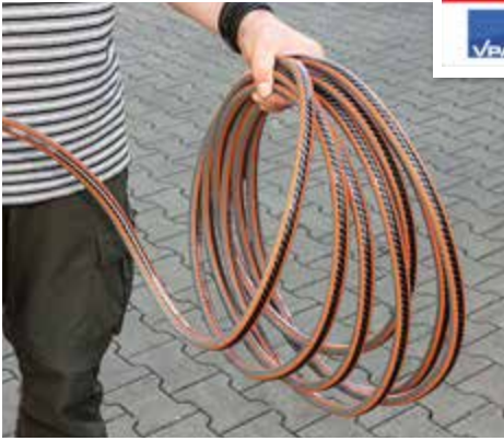
+ HANDLICH: Die besten Schläuche – hier Gardena – bringt man leicht in Form.