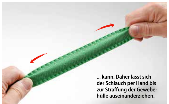
... kann. Daher lässt sich der Schlauch per Hand bis zur Straffung der Gewebenhülle auseinanderziehen.