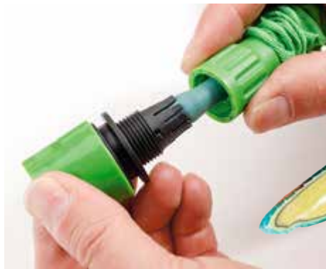
- GESPART: Bei billigen Flex-Schläuchen fehlt eine solche Sicherung (hier Plantiflex).