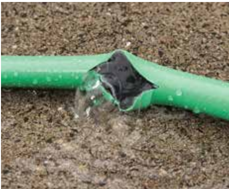
GEPLATZT: Bei hohem Druck reißen übliche Schläuche auf (hier Aqua Garden bei 26 bar).