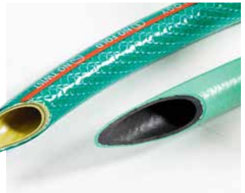
AUFBAU: Mehr Wandschichten bieten mehr Stabilität: Links Fitt, rechts Aqua Garden.