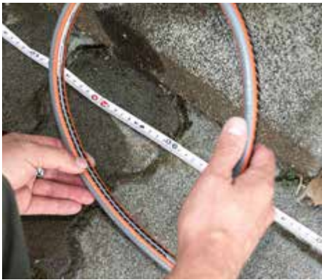
+ ZUGABE: Gardena spendiert rund einen halben Meter Länge als Zugabe.