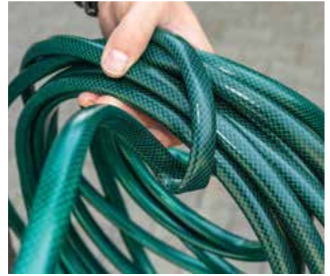
- DÜNN: Billigschläuche (Economic) bieten zu wenig Stabilität und verdrehen sich.