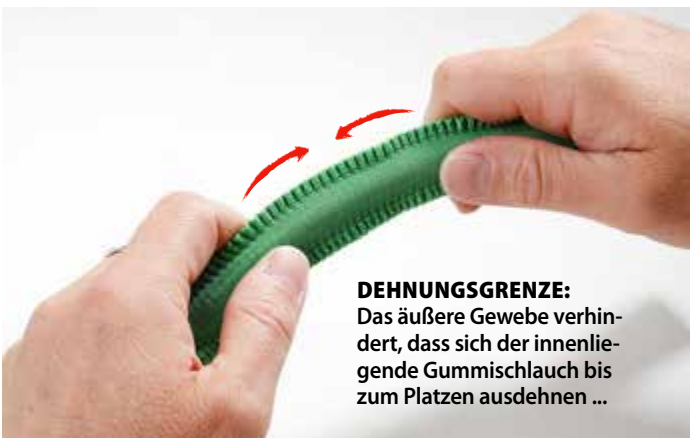
DEHNUNGSGRENZE: Das äußere Gewebe verhindert, dass sich der innenliegende Gummischlauch bis zum Platzen ausdehnen ...