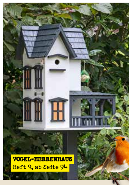
VOGEL-HERRENHAUS Heft 9, ab Seite 94