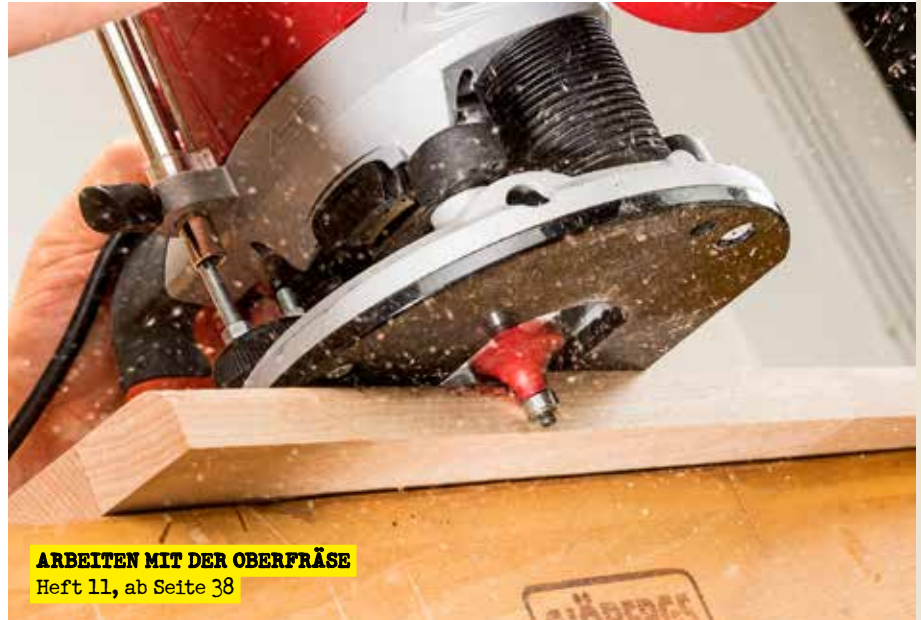
ARBEITEN MIT DER OBERFRÄSE Heft 11, ab Seite 38