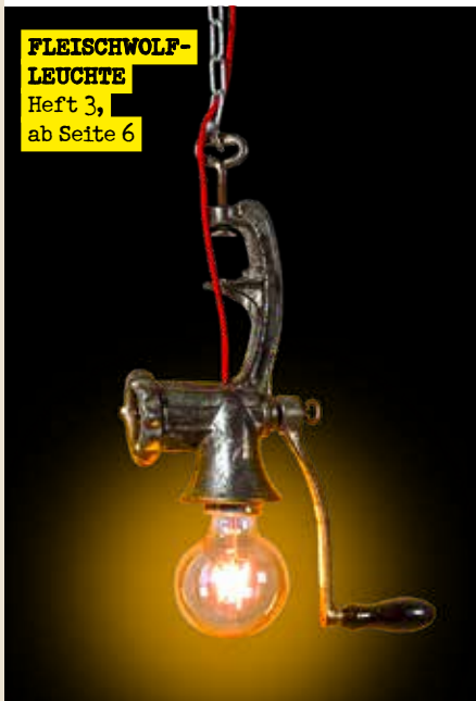
FLEISCHWOLF-LEUCHE Heft 3, ab Seite 6