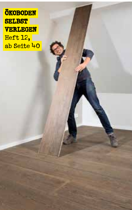
ÖKOBOden SELBST VERLEGEN Heft 12, ab Seite 40