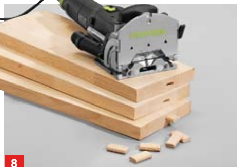
8 Auch die Stufen erhalten eine seitliche Fräsung für den Dominodübel