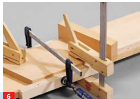
6 Platzhalter für die Treppenstufe einlegen und die nächsten Aufdoppelungen wie beschrieben vornehmen