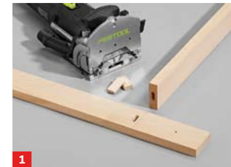
1 Zargen zuschneiden (die hintere Zarge wird von innen gegen die Hochbett-Stützen geschraubt), Dübellöcher fräsen

Sie haben noch Platz am Kopf- bzw. Fußteil des Hochbetts? Nutzen Sie den Raum, um einen Schreibtisch anzubauen. Tischzarge und Beine haben wir aus Buchenholz-Reststücken gebaut, die Tischplatte aus beschichteter Spanplatte