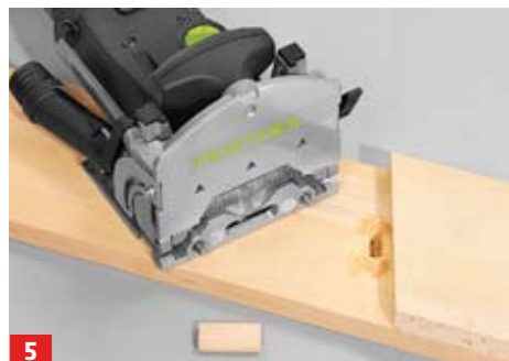
5 Ein Fräs-Langloch für den Domino-Dübel sorgt bei der Endmontage der Treppe dafür, dass sich die Stufen nicht verschieben