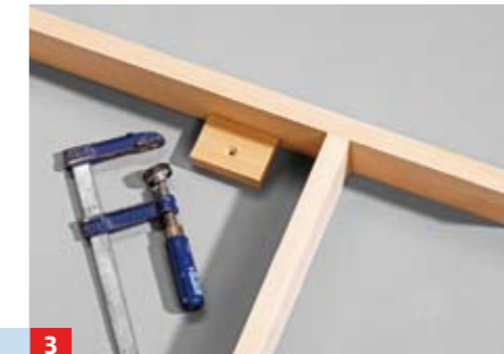
3 Vier solcher Montageklötzchen für die Tischplatte in die Zarge leimen