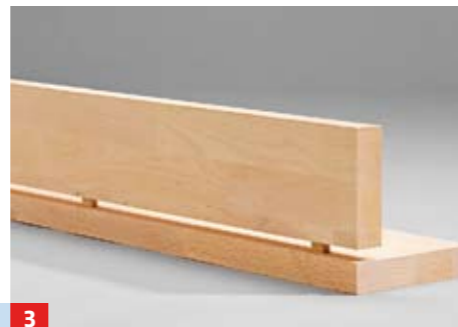
3 Domino-Dübel „trocken“ einstecken und auf Passgenauigkeit prüfen