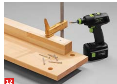
12 Die Längszargen demontieren, Leim angeben (wieder Nägelchen einsetzen), verpressen und verschrauben