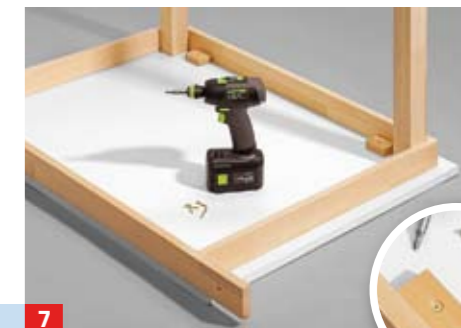
7 ... Stechbeitelklinge abstreifen und schleifen. Platte mit Zarge verschrauben und am Bett montieren