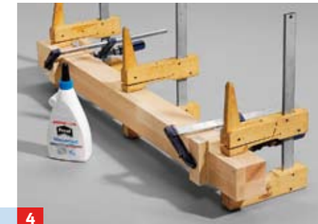
4 Tischbeine aus je zwei 27er-Leimholzstreifen aufdoppeln. Auch hier Zulagen gegen Verrutschen verwenden