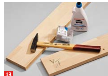
13 Der Rausfallschutz wird ebenfalls unter Verwendung der Hilfsnägel verleimt und später von innen mit der Zarge verschraubt