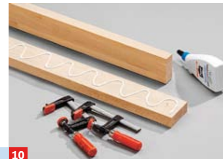
10 ... verhindern beim Verleimen, dass die Bauteile aufschwimmen und sich gegeneinander verschieben. Fest verpressen ...