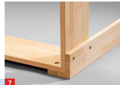
7 ... Spiralbohrer im Schraubendurchmesser die Durchgangsbohrung herstellen. So gehen Sie auch von der innenliegenden ...