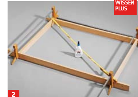
2 Beim Verleimen das Stichmaß (identische Länge der Diagonalen) überprüfen und mit Leimklemmen verpressen