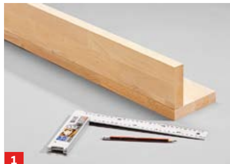
1 Die winkelförmigen Stützen werden aus 27er Leimholz gefertigt. Die stumpf miteinander zu verleimenden Bauteile ...

Das Gestell aus massivem, 27 mm starkem Buche-Leimholz ist simpel konstruiert. Die enorme Stabilität wird jedoch nicht nur durch die Materialstärke erreicht, sie entsteht vor allem durch die Konstruktion der Stützen in Form von Winkeln