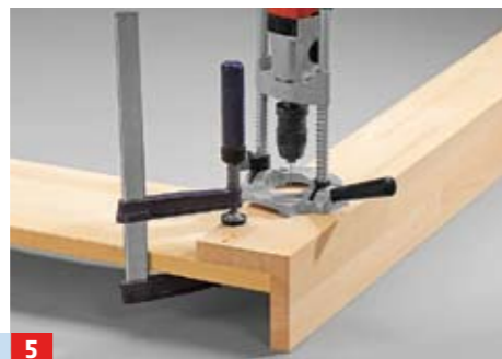
5 Markieren Sie zunächst die Bohrlöcher für die Verschraubung mit einem dünnen (z. B. 3-mm-) Bohrer durch die Stützen in die ...

SELBST WISSEN PLUS Auch wenn bei dem 27 mm starken Material die Auflagefläche der stumpfen Verleimung relativ groß ist, sollten Sie die Winkligkeit beim Verleimen nochmals kontrollieren. Eine einfache und doch effektive Methode besteht darin, rechtwinklig zugeschnittene Hilfsplatten während der Abbindezeit mit Schraubzwingen im Winkel zu fixieren.