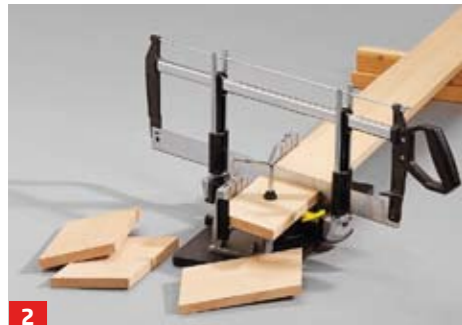
2 Die innenliegenden Aufdoppelungen der Wangen lassen sich sehr gut mit der Gehrungssäge zuschneiden