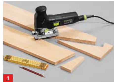
1 Schneiden Sie zunächst die durchgehenden, äußeren Wangen aus 18-mm-Leimholz sorgfältig mit der Stichsäge zu

Äußerst massiv präsentiert sich die Treppe: Die Wangen aus aufgedoppeltem 18er Leimholz mit zwischenliegenden 27er Stufen ermöglichen ein bequemes Erklimmen der Liegefläche. Montieren Sie die Treppe mit Spanplattenschrauben, die Sie durch die Zargen in die angeschrägten Wangen eindrehen