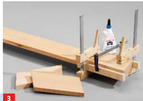
3 Beginnen Sie am unteren Ende und leimen das erste Element auf. Vermeiden ...