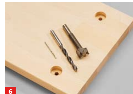
6 ... dahinter fest verspannten Bettzargen. Anschließend erst mit dem Forstnerbohrer ein Sackloch und dann mit dem ...

Rundköpfen ist das Bett einfach und beliebig häufig montier- und zerlegbar. Den Rausfallschutz benötigen Sie normalerweise nur dann, wenn das Bett von Kindern benutzt wird. Dann sollten alle Seiten gesichert werden, die nicht unmittelbar an der Wand stehen. Der Anbauschreibtisch macht das Bett vielseitiger. Übrigens: Den hier aus Platzgründen nicht dargestellten Bau des Auszugschranks zeigen wir im folgenden Heft. Auf dem Bauplan befinden sich jedoch selbstverständlich auch die Angaben zur Konstruktion dieses Elements.