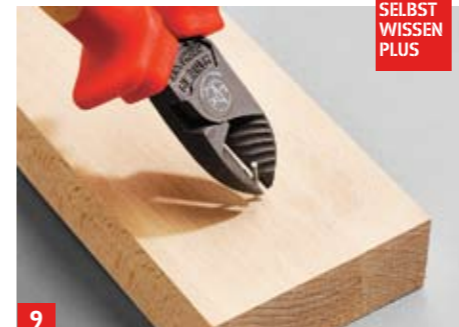
9 Die Auflagerleisten für das Rost bestehen aus aufgedoppeltem 27er Leimholz. Eingeschlagene und abgeknappte Nägel ...