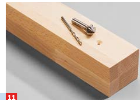
11 ... und für die Montage auf den Längszargen bohren und senken