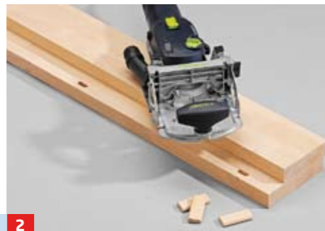
2 ... aufeinanderstellen, Dübelpositionen anzeichnen und Frässchlitz (hier mit der Domino-Dübelfräse) fertigen