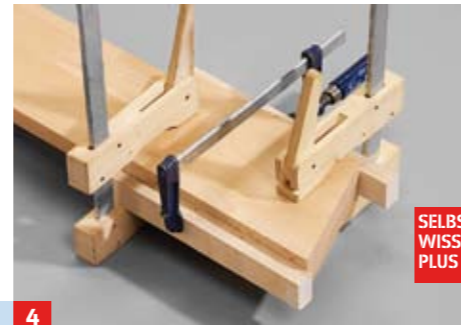
4 ... Sie seitliches Verrutschen, indem Sie zwei mit Malerkrepp beklebte Zulagen mit einer Schraubzwinge festspannen