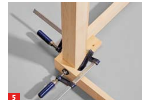
5 Die geschliffenen Beine werden in die vorderen Zargenecken eingeleimt