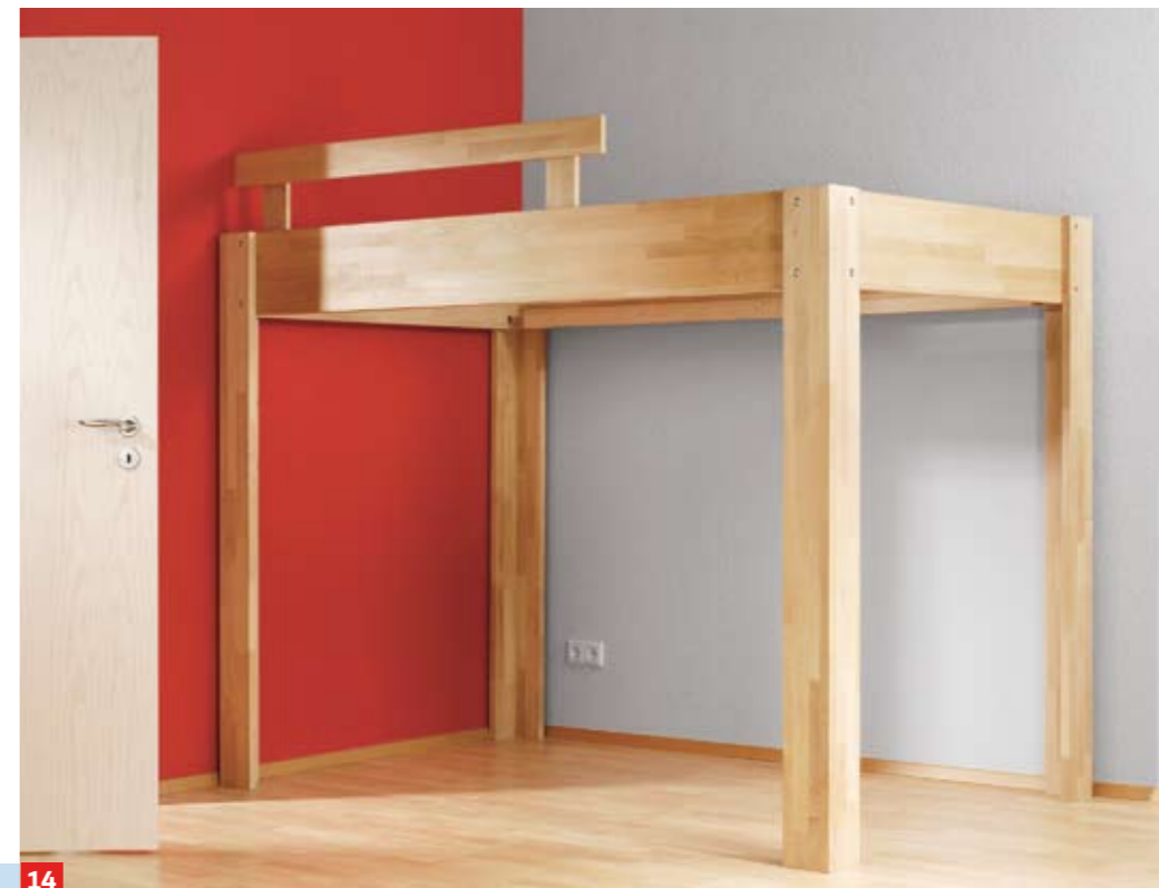
14 Die Montage des Bettgestells erfolgt an Ort und Stelle. Vorher sollten Sie jedoch alle Holzflächen sorgfältig schleifen und mit Lack, Lasur, Öl oder Wachs schützen