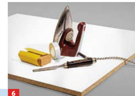
6 Tischplattenkanten mit Schmelzkleber-Umleimer versehen. Aufbügel, andrücken, überstehende Kanten mit der Seite der ...