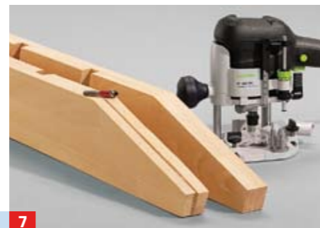
7 Die obere Aufdoppelung grob zuschneiden, verleimen und mit Oberfräse und Bündigfräser schrittweise nachbearbeiten