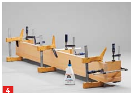
4 Anschließend Leim angeben und die Bauteile rechtwinklig miteinander verpressen