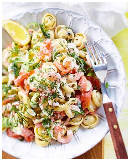
Schwedische Lachsnudeln mit Frischkäsesoße Heft 7 Seite 8