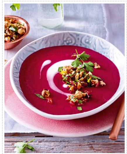
Rote-Bete-Suppe mit Nussstreuseln Heft 10 Seite 42