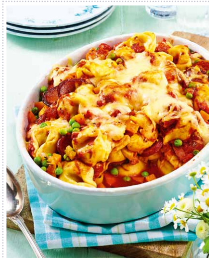
Tortelloni-Auflauf mit Kabanossi Heft 5 Seite 27