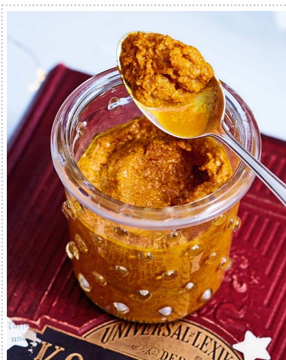
Indischer Sonnengruß Heft 12 Seite 36