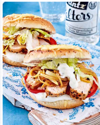
Saftige Hähnchengyros-Burger Heft 6 Seite 16