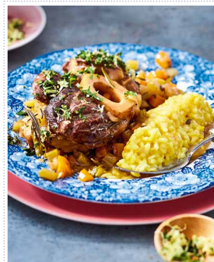
Ossobuco alla milanese Heft 10 Seite 8