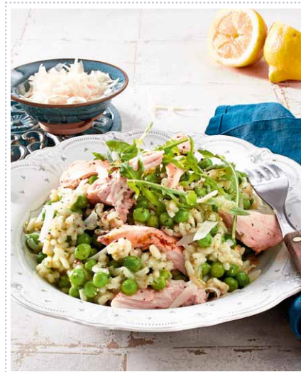
Zitronenhähnchen auf grünem Risotto Heft 10 Seite 17