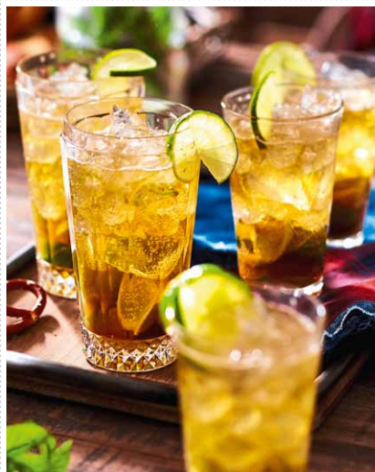
Caibierinha Heft 10 Seite 39