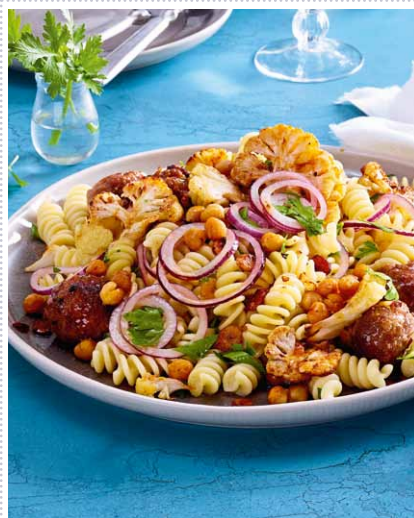
Nudelsalat mit geröstetem Blumenkohl und Hackbällchen Heft 7 Seite 9