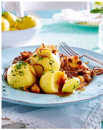
Kartoffelklöße zu Zwiebelrostbraten Heft 2 Seite 11