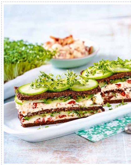
Pumpnickelstreifen Heft 2 Seite 46