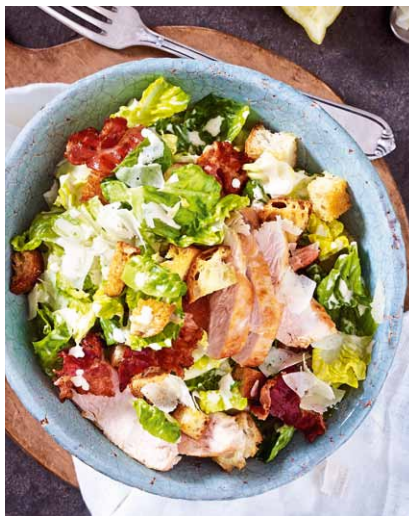
Herzhafter Caesar Salad Heft 12 Seite 43