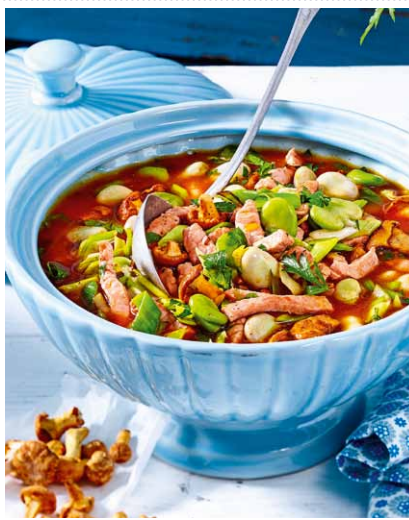
Sommereintopf mit Kasseler Heft 7 Seite 15