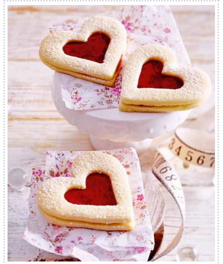
Gefüllte Herzen Heft 11 Seite 27