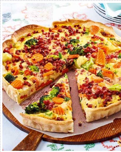
Gemüsequiche mit Schinken Heft 6 Seite 19