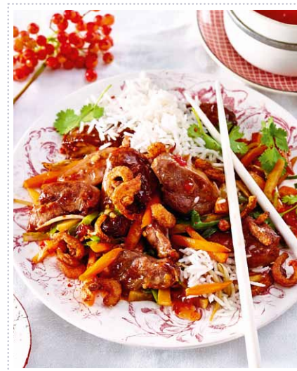
Knusperkeulen auf mediterranem Schmorkohl Heft 11 Seite 13