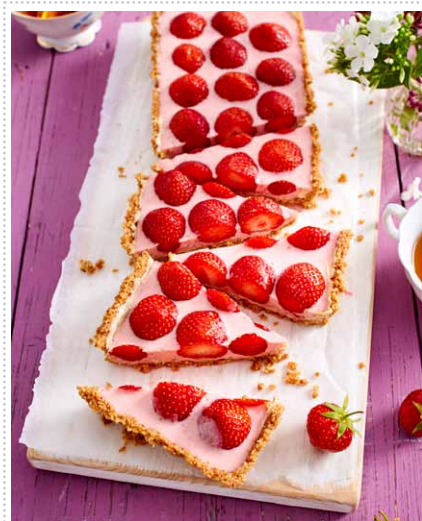
Erdbeer-Pannacotta-Tarte Heft 6 Seite 58