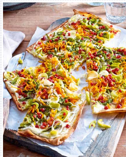
Knuspriger Flammkuchen Heft 2 Seite 28