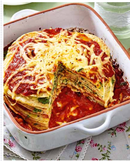
Überbackene Spinatpfannkuchen Heft 4 Seite 14