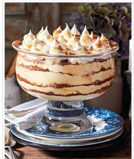
Coupe Caramel mit geflämmtten Baisertuffs Heft 11 Seite 37