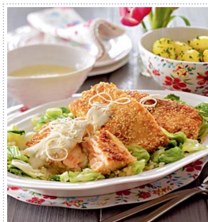
Lachs mit Meerrettich & Spitzkohl, Heft 3 Seite 24