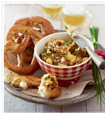
Tomaten-Obatzda, Heft 10 Seite 39