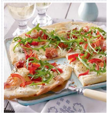
Flammkuchen mit Ziegenkäse & Schinken, Heft 6 Seite 48