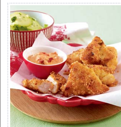
Hähnchen-Nuggets mit Paprikadip, Heft 10 Seite 26