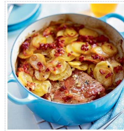
Cider Pork – Schweine-Kartoffel-Auflauf, Heft 6 Seite 55