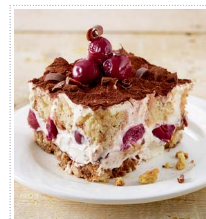
Cantuccini-Tiramisu mit Kirschen, Heft 4 Seite 48