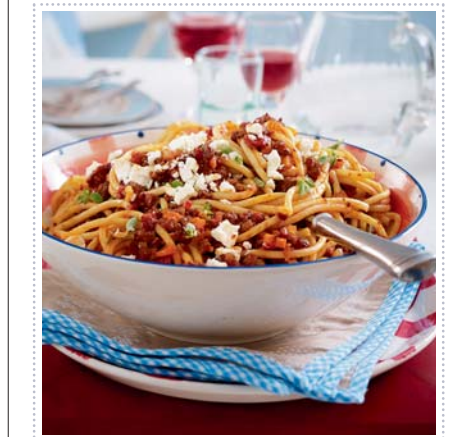
Bucatini mit Lambbolognese, Heft 3 Seite 30