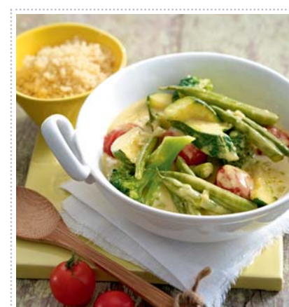
Gemüse-Kokos-Curry zu Couscous, Heft 6 Seite 12