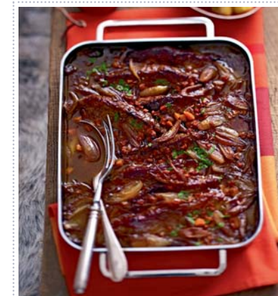
Burgundersteaks mit Rosmarinkartoffeln, Heft 11 Seite 32