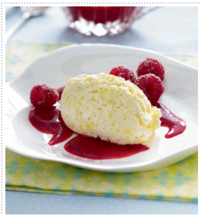
Aprikosenmousse und Himbeersoße, Heft 7 Seite 52