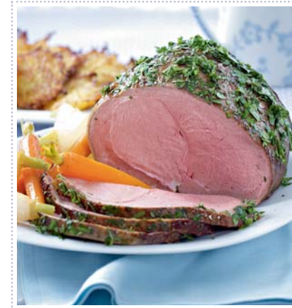
Saftiger Kalbsbraten mit Frühlingsgemüse, Heft 5 Seite 22