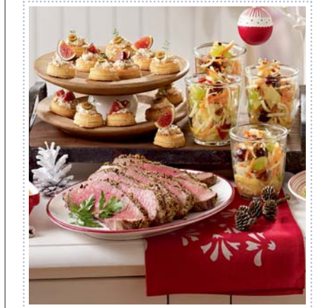
Weihnachts-Buffer, Heft 12 Seite 30