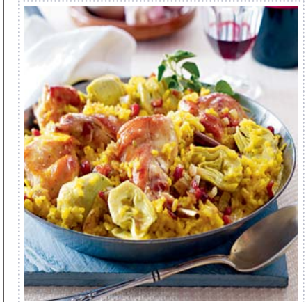
Reis nach Cáceres-Art mit Kaninchen, Heft 3 Seite 53