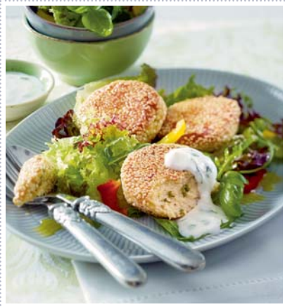
Sesamtaler auf gemischtem Salat, Heft 7 Seite 44