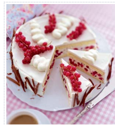
Johannisbeertorte „Kir royal“, Heft 7 Seite 60