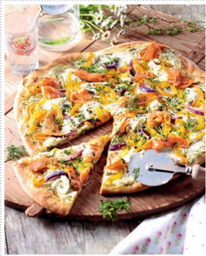
Lachspizza mit Ziegenfrischkäse Heft 11 Seite 22