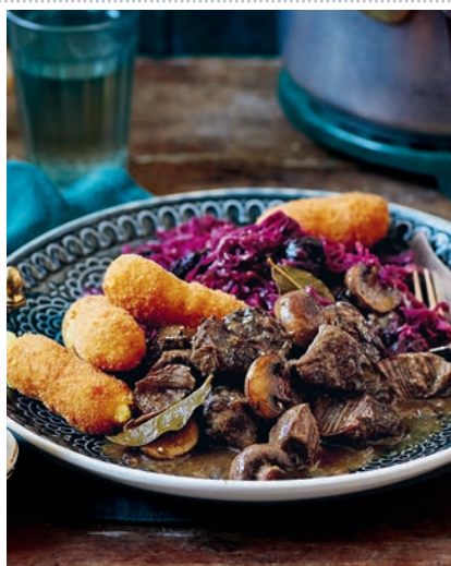
Zartes Rehulasch mit selbst gemachten Kroketteen Heft 11 Seite 67