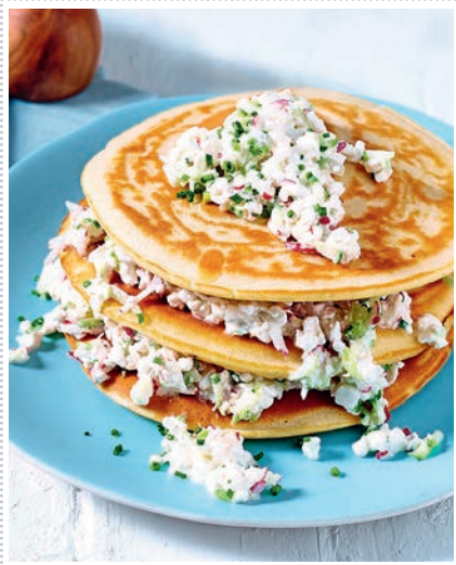
Herzhafter Pancake-Turm Heft 9 Seite 46