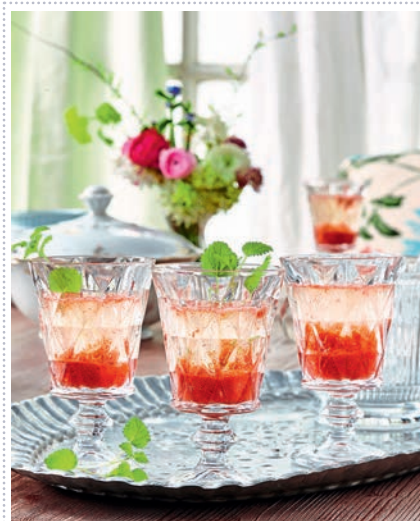
Erdbeer-Rhabarber-Bellini Heft 4 Seite 38