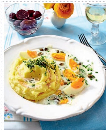
Eier Königsberger Art Heft 4 Seite 43