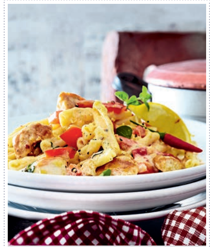
Nudeln mit Hähnchen und cremiger Paprikasoße Heft 3 Seite 30