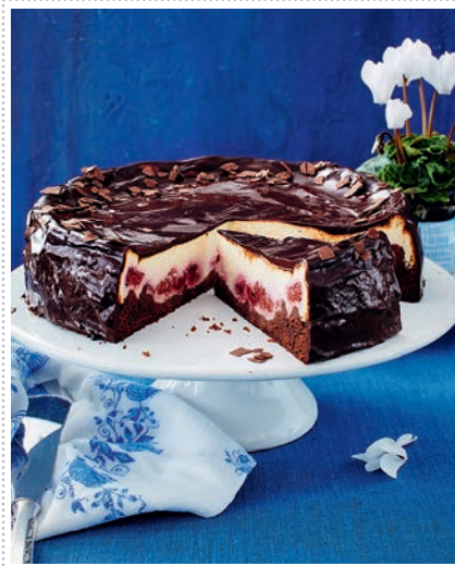
Himbeer-Mascarpone-Torte mit Schokoguss Heft 1 Seite 58