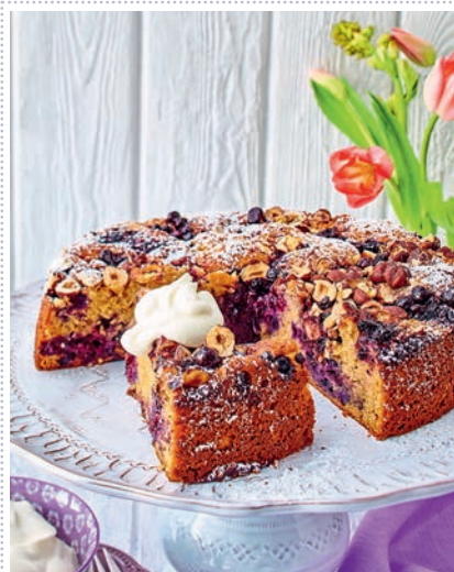
Blaubeer-Becherkuchen mit Nussknusper Heft 3 Seite 59