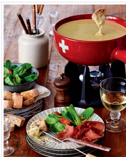
Käsefondue Heft 12 Seite 55