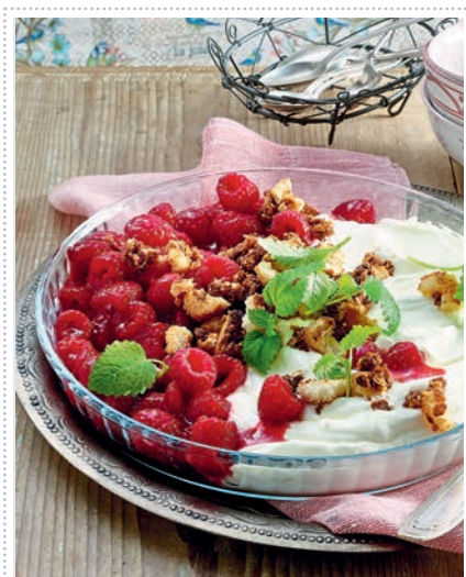
Himbeerdessert mit luftigem Sauerrahm und Knusperbröseln Heft 6 Seite 18