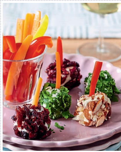
Frischkäseballchen mit Gemüsesticks Heft 2 Seite 32