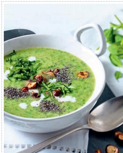
Brokkolisuppe mit Chia-Nuss-Topping Heft 12 Seite 49