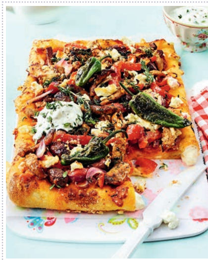
Gyros-Feta-Kuchen mit gefülltem Rand Heft 5 Seite 18