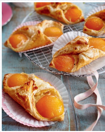
Aprikosen-Blätterteig-Gebäck Heft 7 Seite 24 (Booklet)