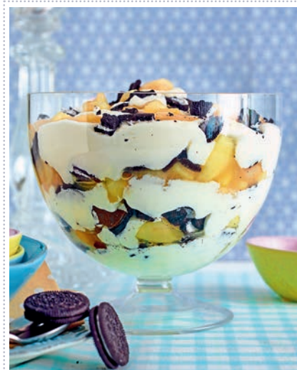
Apfel-Zitronen-Pokal mit „Oreos“ Heft 1 Seite 36