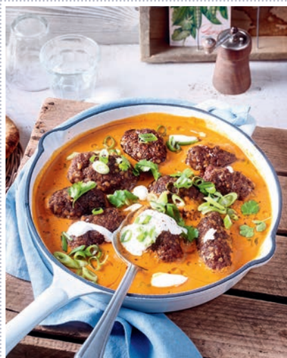
Indische Hack-Linsen-Röllchen Heft 5 Seite 28