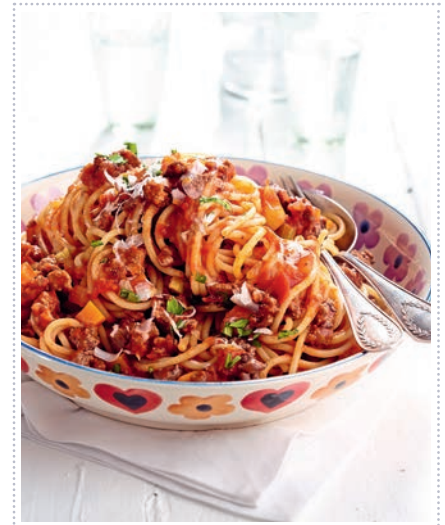
Klassische Bolognese Heft 11 Seite 16 (Booklet)