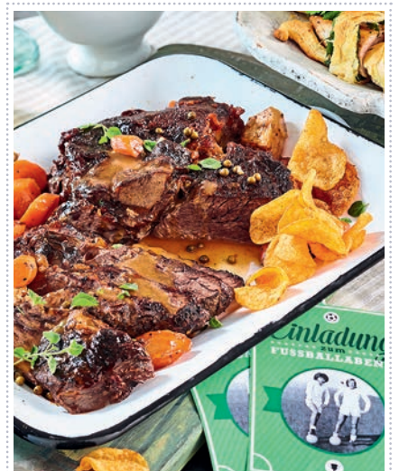
Hohe Rippe mit Pfeffer-Cognac-Soße Heft 7 Seite 36