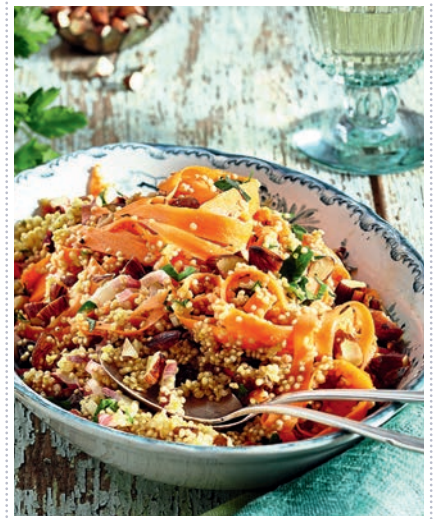
Möhren-Quinoa-Salat Heft 10 Seite 28